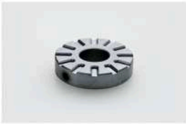
Art-Nr. 10981 Teilscheibe T-6 für Kernbohrer 6-schneidig