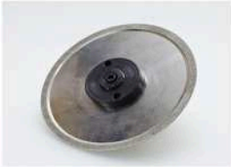
Art-Nr. 15330 Diamantschleifscheibe dreiseitig D126 mit Radius (Kernbohrer)